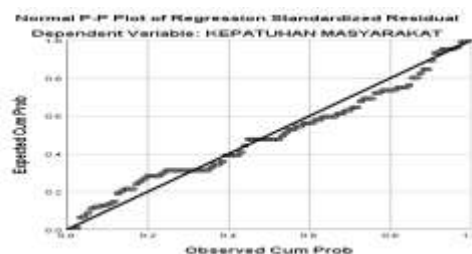
Gambar 1: Uji Normalitas

Uji normalitas digunakan untuk mengetahui apakah data mengikuti distribusi normal. Ini dilakukan untuk memastikan bahwa analisis parametrik dapat dilakukan (Handayani & Subakti, 2021) dalam (A. P. Sari et al., 2024).