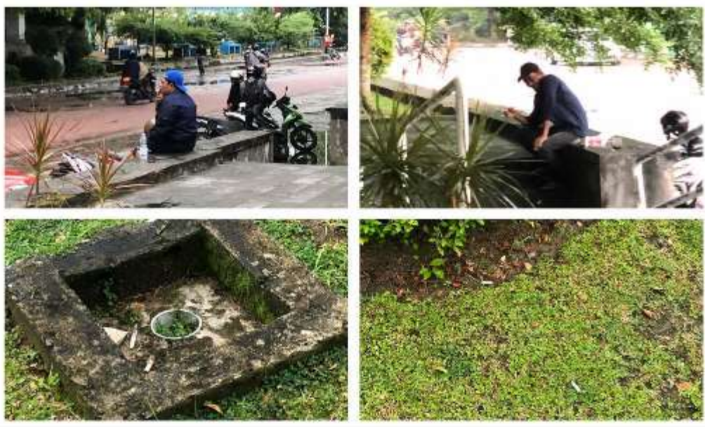
Gambar 1: Fenomena Perilaku Merokok di Kawasan Taman Samarendah Kota Samarinda

Meskipun Peraturan Daerah Kota Samarinda Nomor 8 Tahun 2017 tentang KTR telah diberlakukan, namun masih sering ditemukan masyarakat yang merokok di tempat publik, tak terkecuali di Taman Samarendah meski papan informasi mengenai Taman Samarendah merupakan KTR telah tersedia. Para pelanggar ketentuan KTR tersebut sebagian besar adalah perokok yang merupakan para remaja dan dewasa (lihat gambar 1). Fenomena pencemaran udara dari rokok tentu mengganggu kebersihan udara yang ada di kawasan Taman Samarendah, serta mengakibatkan imbas negatif terhadap orang lain yang berada di kawasan tersebut.