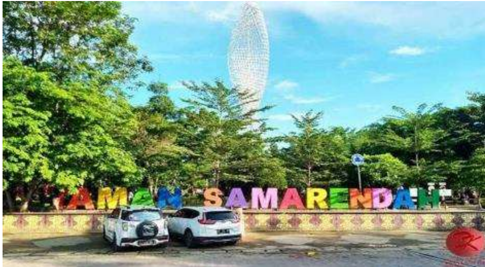
Gambar 2: Taman Samarendah Kota Samarinda