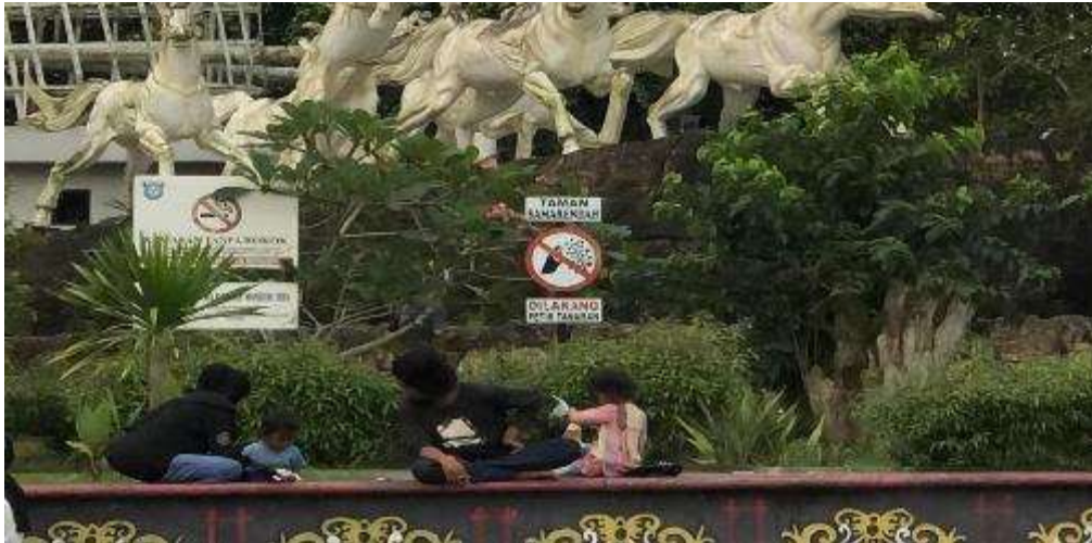
Gambar 3: Papan Pemberitahuan KTR dan Larangan Merokok di Taman Samarendah