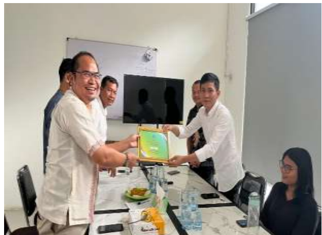
Gambar 4. Penutupan Kegiatan Magang