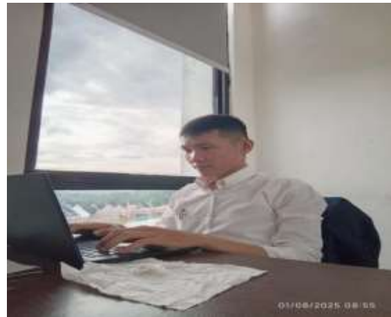
Gambar 2. Dokumentasi kegiatan pelaksanaan Magang