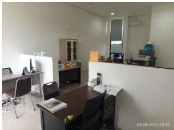
Gambar 3. Dokumentasi Ruangan Kerja