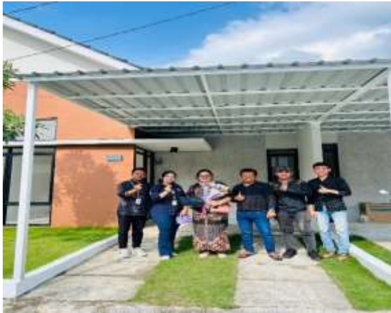
Gambar 1. Dokumentasi Serah Terima Rumah/Properti