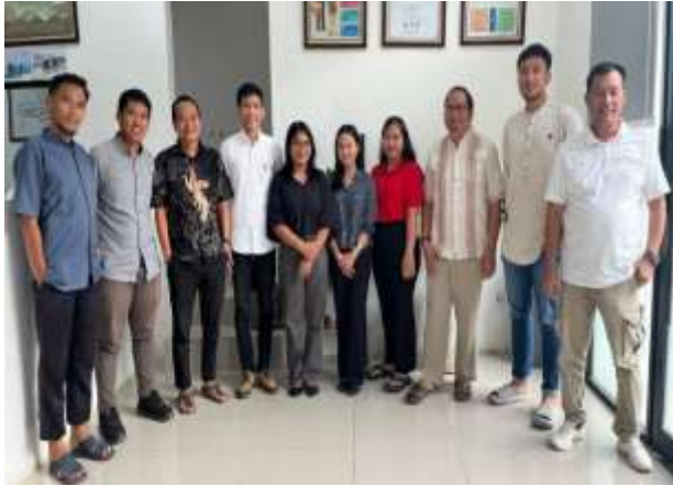
Gambar 4. Penutupan Kegiatan Magang